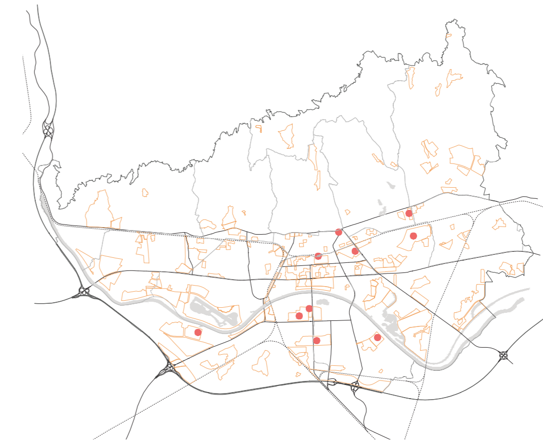
gradski projekti i obuhvati detaljnijih planova