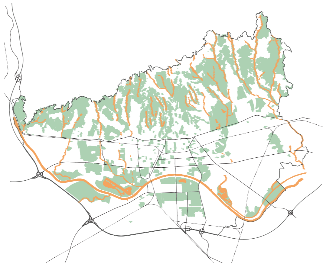
zeleni i plavi infrastruktura